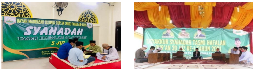
Kegiatan Pelaksanaan Program Tasmi'

Pelaksanaan program tahfidz di Dayah MUQ Pagar Air belum sepenuhnya menerapkan tahapan pelaksanaan sebagaimana dengan Rianto, pelaksanaan yang dilakukan pada tahap pendahuluan hanya melakukan pengabsenan terhadap santri tanpa menanyakan materi dari pertemuan sebelumnya. Berdasarkan hasil penelitian yang ditinjau dari pengelolaan pelaksanaan program tahfidz di Dayah MUQ Pagar Air dengan menggunakan unsur manajemen 7M + 1 I (man, money, methods, material, machines, market, minute, dan information), dapat dijabarkan sebagai berikut: