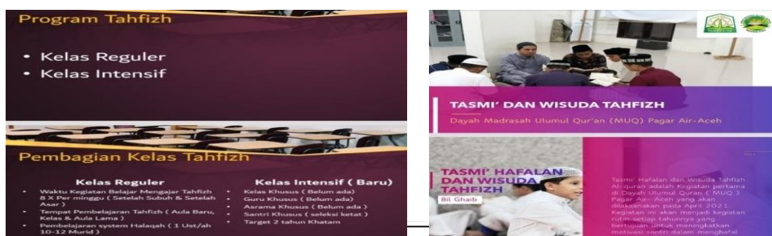
Pembagian Program Tahfidz Kelas Intensif dan Kelas Reguler.