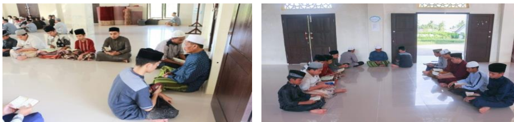
Kegiatan Pelaksanaan Program Tahfidz Kelas Reguler